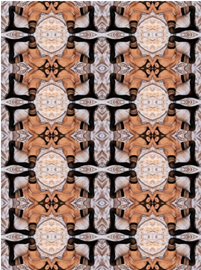
'Sex-mirror #35' (fantasme latex)

La galeria Lina Davidov présente à ART-MADRID les deux dernières séries photographiques de Carmen Arrabal: 'Sex-mirrors' y 'Emotions'.